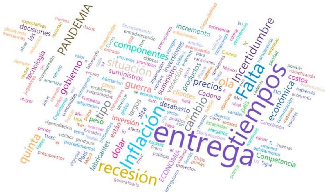
Figura 3: Amenazas para la industria TIC (respuestas de julio 2022)

Siguen pesando los prolongados tiempos de entrega, el aumento en precios y los vientos de recesión aumentan la incertidumbre para la industria; sin embargo, los participantes en la encuesta de julio reconocen que los proyectos de digitalización, servicios y nube, además de la cercanía con los clientes son claves para aprovechar las oportunidades.