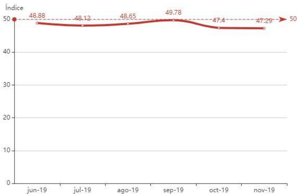
Gráfica del índice de crecimiento

Por otro lado, las que no crecieron cayeron 0.6% y dentro de estas, las que no crecieron nada continúan siendo el porcentaje mayor (22.5%).